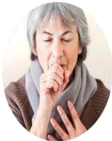
взрослые старше 50 лет