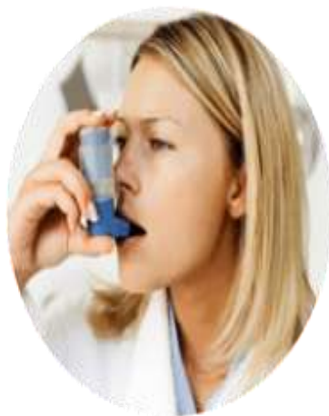
люди, страдающие астмой и диабетом