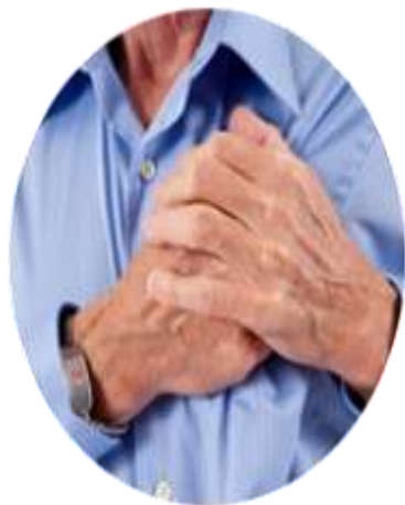
люди, которые в анамнезе имеют легочные или сердечнососудистые заболевания