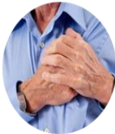
люди, которые в анамнезе имеют легочные или сердечнососудистые заболевания