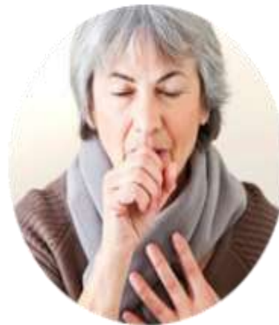
взрослые старше 50 лет