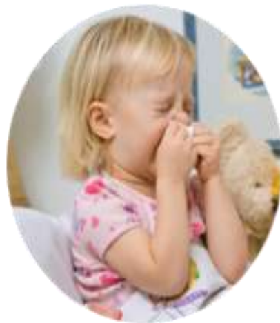
дети в возрасте от 6 месяцев до 4 лет