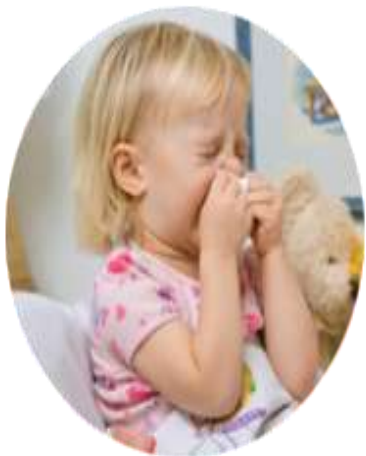
дети в возрасте от 6 месяцев до 4 лет