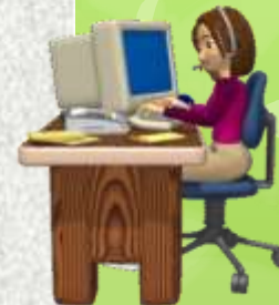
Схема процесса дистанционного образования